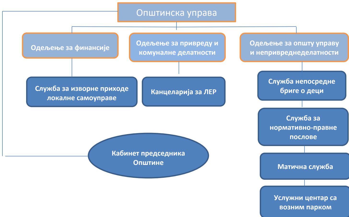
Дијаграм 2: Организациона структура Општинске управе Мерошина